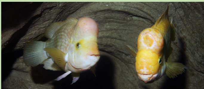
T : +/- 20 cm près des parois abruptes Citrinellum Amérique centrale