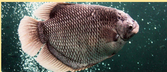
T : entre 45 et 75 cm dans les espaces dégagés Gourami géant Asie du Sud-Est