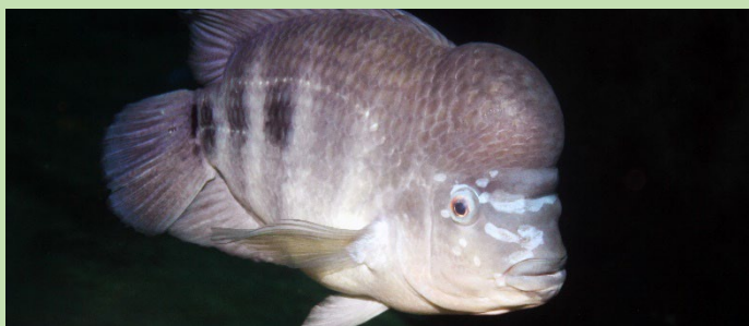
T : jusqu'à 25-30 cm près des fonds rocheux Bossu du Tanganyika Afrique centrale