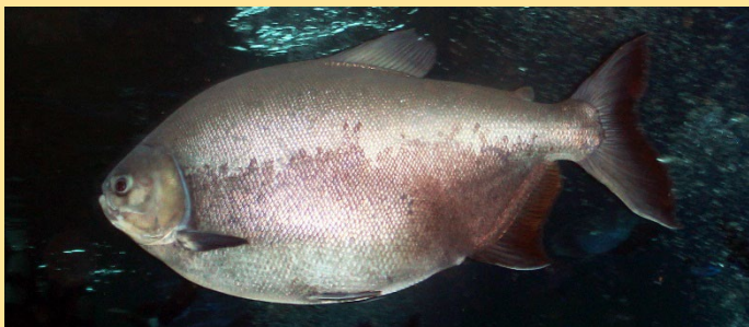
T : de 70 cm à 1 m en bancs à la surface Pacu noir Amérique du Sud